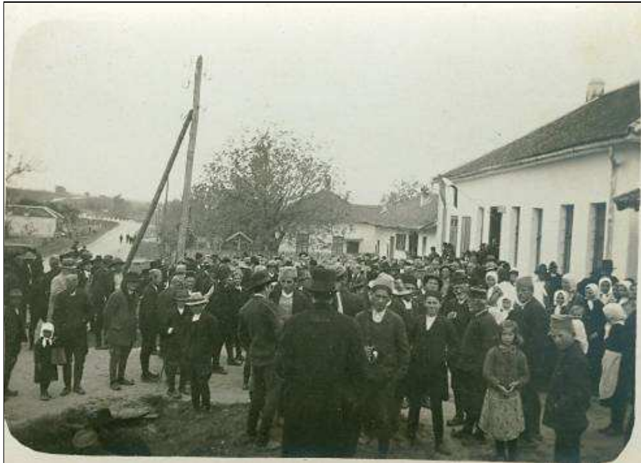
Са једног збора Удружене опозиције у Бунару