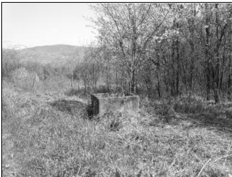
Бунар на Таборишту (Логоришту) налази се на западној страни Постојао је и у време устанака, а уредили су га Аустријанци током окупације у Првом светском рату

У оквиру одбране Србије 1813. године, Јагодинска нахија је добила поново важну улогу, као и неколико пута током устанка. Поред утврђивања саме Јагодине, утврђивани су и положаји код села Белице: Падалиште и Табориште. По ратном плану јаке пешадијске снаге требало је Младен Миловановић да остави у Јагодини и на Таборишту.