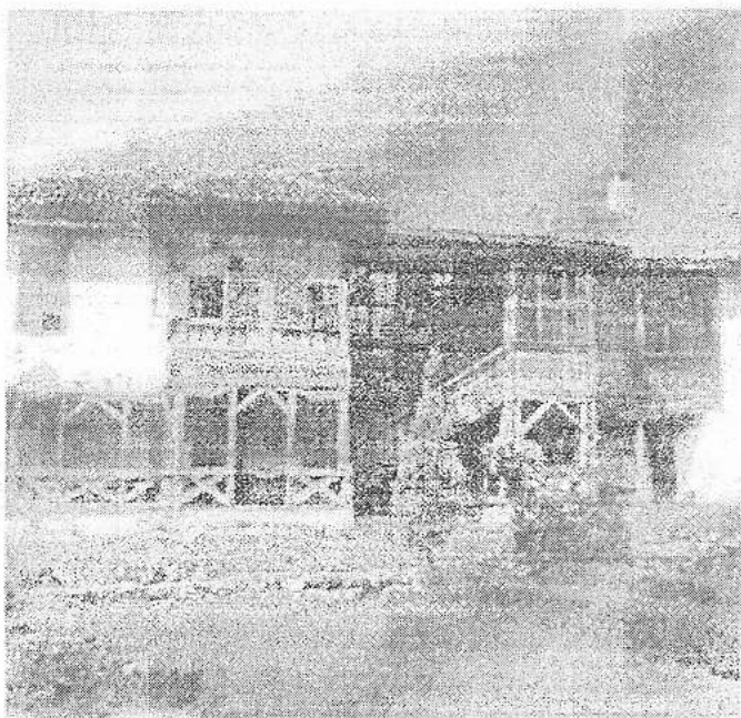
Конак манастира Јовановце