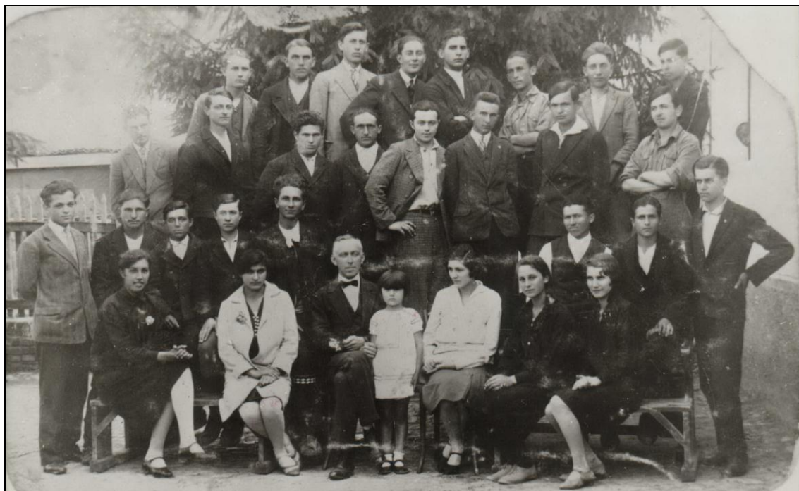
Ученици VII разреда гимназије 1929. године