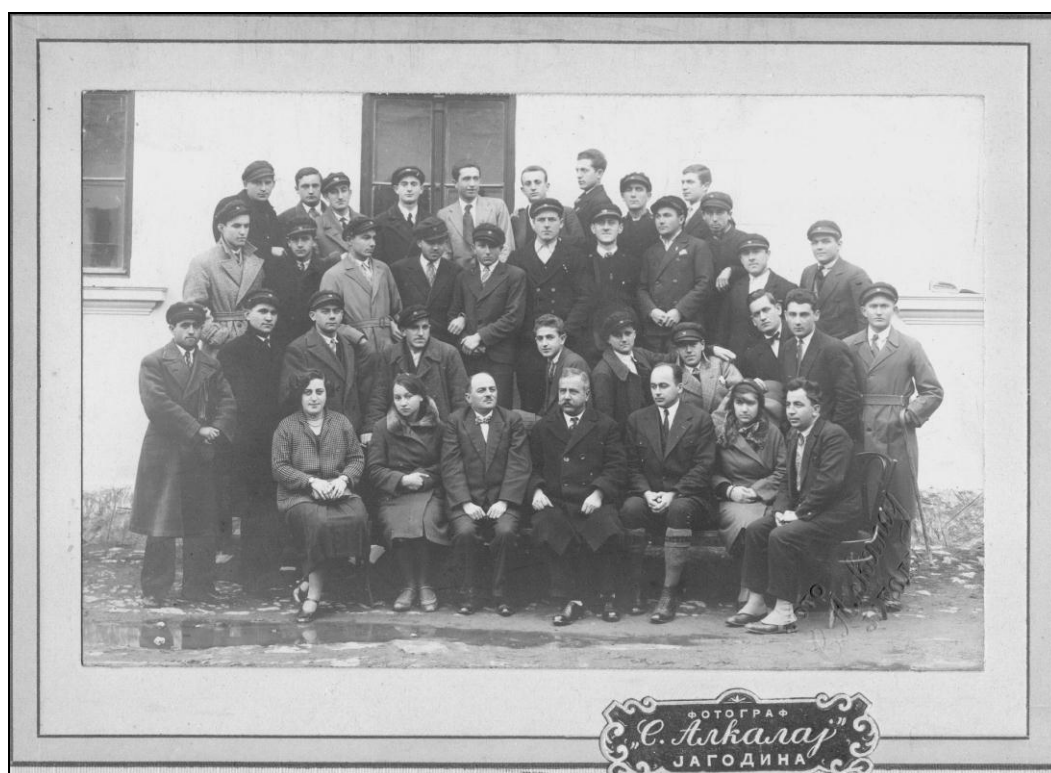
Ученици гимназије око 1930. године