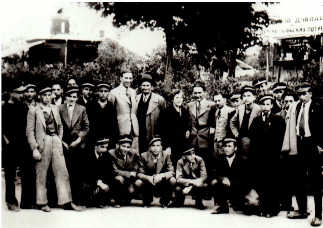
На екскурзији у Врњачкој Бањи маја 1938. године

Током школске године организоване су посете: 13. априла 1938. године са ученицима првог и другог одељења четвртог разреда пивари у Јагодини и електричној централи 13. и 14. маја са ученицима сва три одељења четвртог разреда. 310