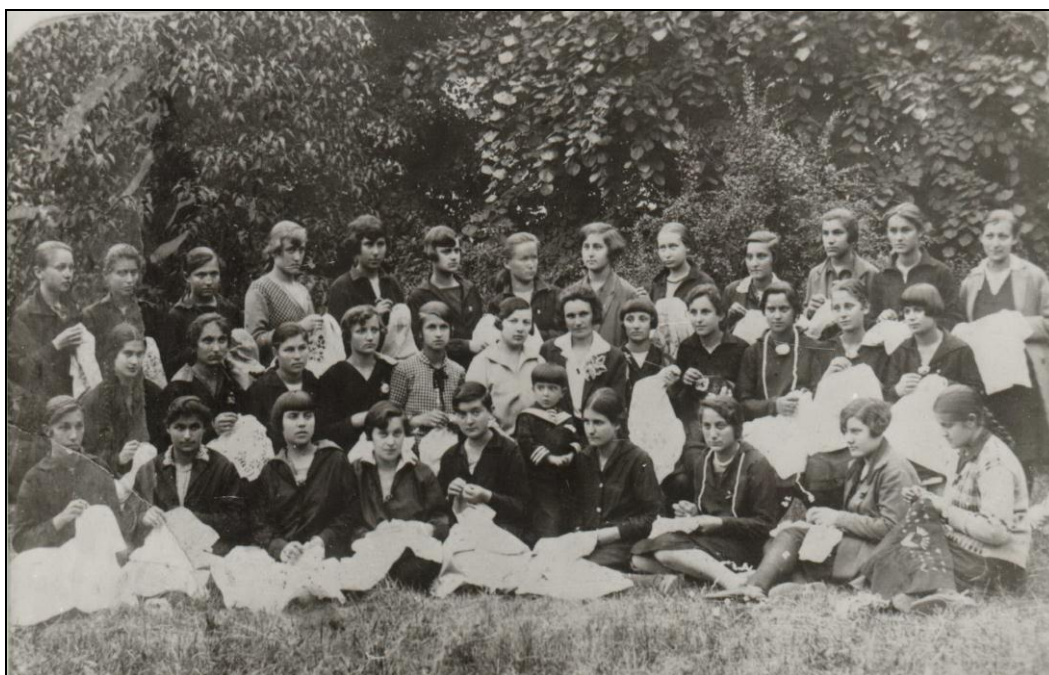
Ученице IV-3 разреда гимназије на часу женског ручног рада 1927. године

Почетком октобра 1927. године, због већег броја уписаних ђака, тражено је отварање још једног одељења петог разреда. С тим се морала извршити нова подела предмета. Наведен је недовољан број наставника за српски језик, јер су тај предмет, у нижим разредима, предавали нестручни наставници, а у вишим разредима, наставници којима је српски језик споредан предмет. Затим је тражено постављење наставника за латински језик, јер су тај предмет предавали наставници којима је латински језик по „ц“. Поред отварања још једног одељења петог разреда, тражено је постављање два наставника за српски језик и једног наставника за латински језик. Министар је одобрио захтеве гимназије 10. децембра исте године. 114