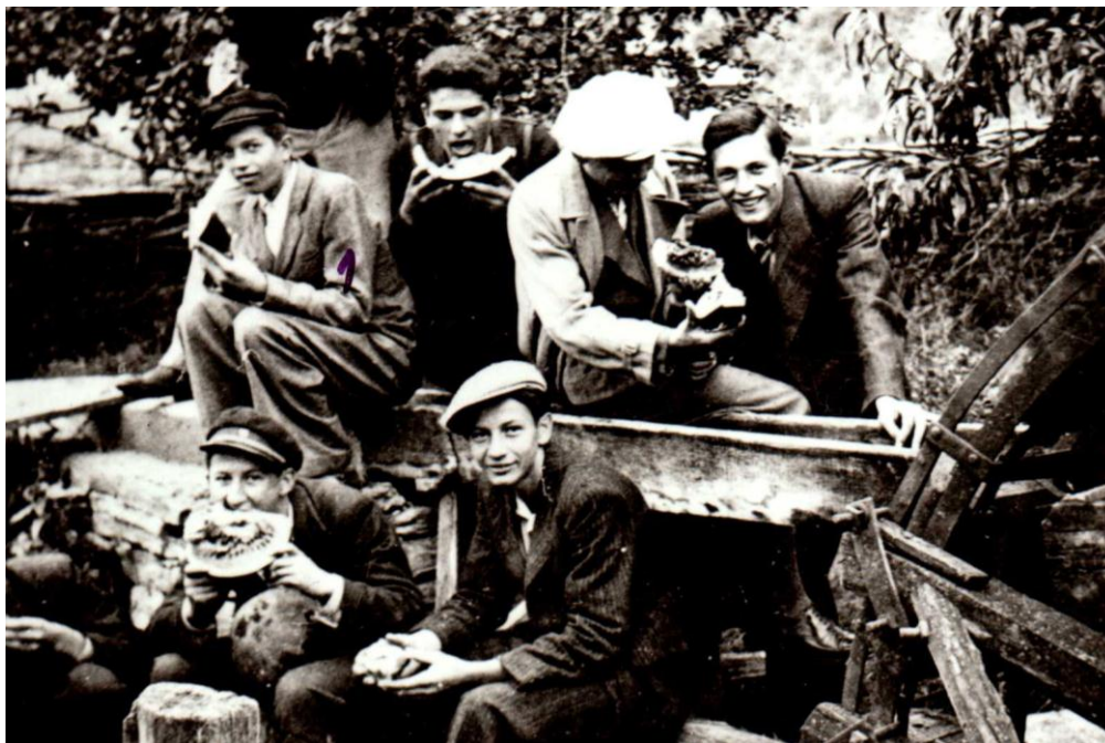
Са излета у село Мајур августа 1936. године

Школске 1937-1938. године изведена је екскурзија 18. и 19. септембра 1937. године до Београда са ученицима трећег и четвртог разреда; Полудневне екскурзије изведене су 30. септембра 1937. године: први разред до Вољавча, други разред до Праћине, трећи разред до Буковча, четврти разред до Трнавe. Научно-