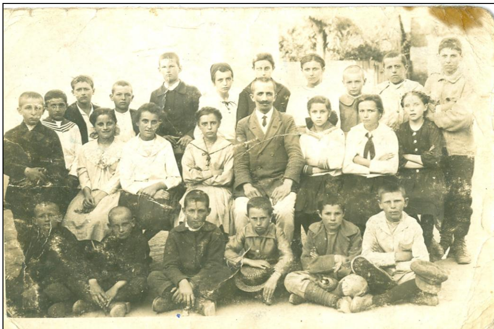
Ученици првог разреда гимназије 1919. године