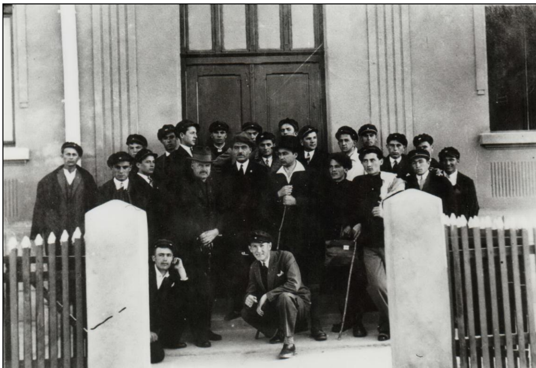
Матуранти гимназије у посети Рековцу 1930. године