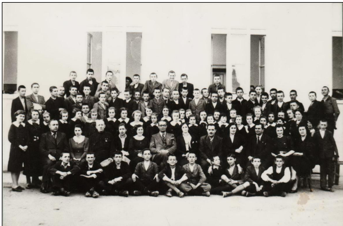
Матуранти ниже гимназије са професорима 1937. године