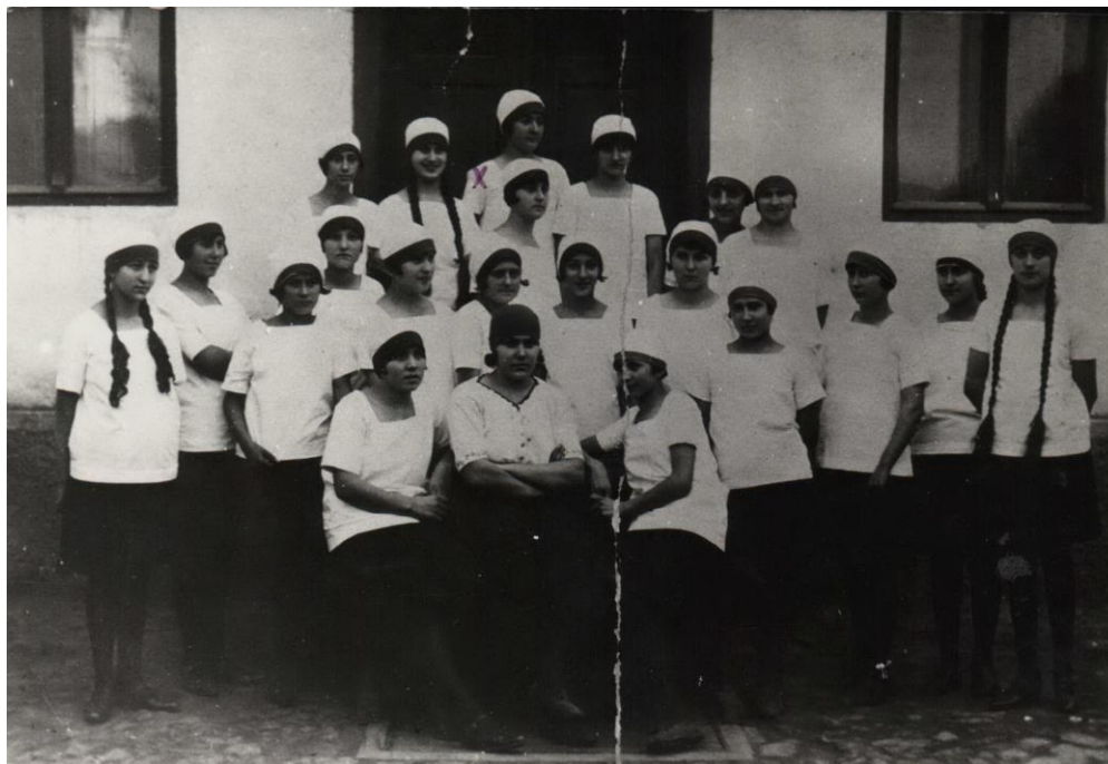
Ученице четвртог разреда гимназије 1926. године