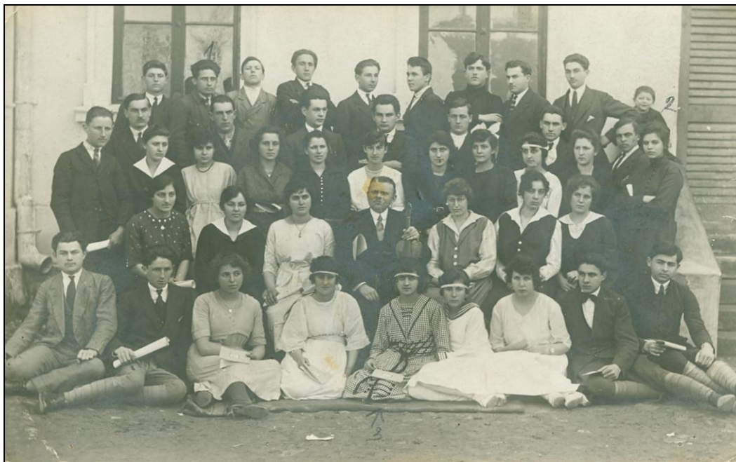
Светосавски хор јагодинске гимназије око 1920. године