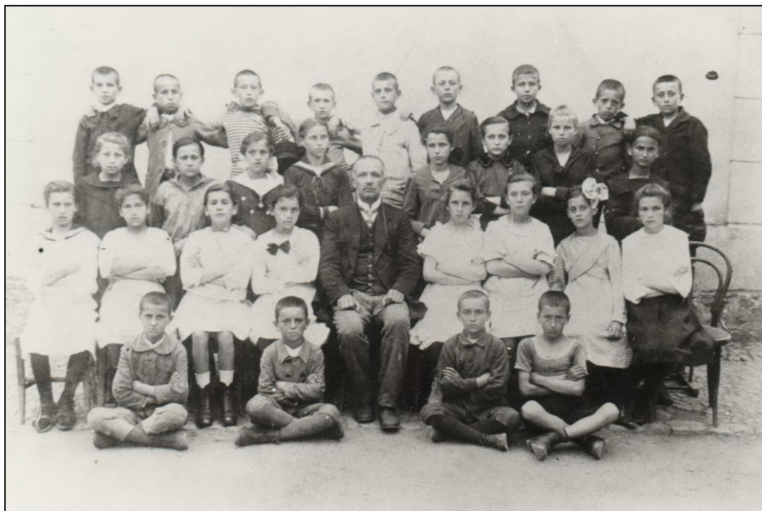
Ученици првог разреда гимназије школске 1918/19. године

редовног школског рада у Учитељској школи, јер су тројица наставника из ове школе. 12