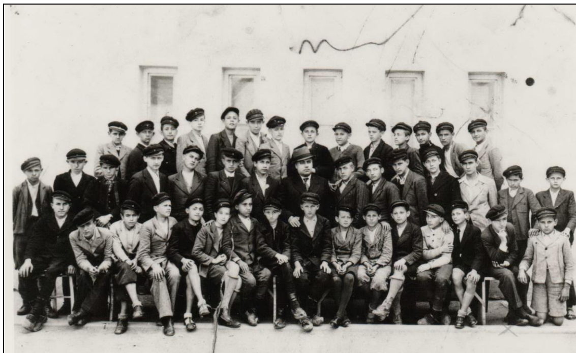
Ученици IV разреда гимназије 1937. године

28. јуна на Видов дан саопштен успех ученицима и издата им сведочанства.