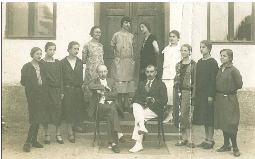
Ученице гимназије 1924. године