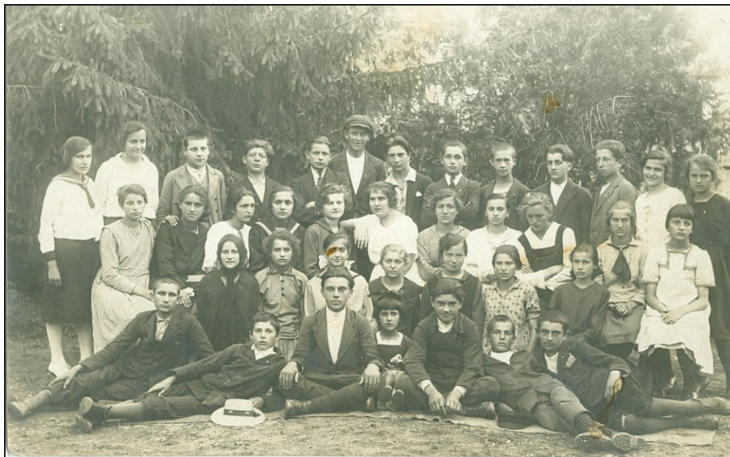
Четврти разред гимназије 1923. године

Изложба цртежа организована је од 27 до 29. маја. Изложба женских радова није организована, јер наставница женског рада није показала довољно активности.