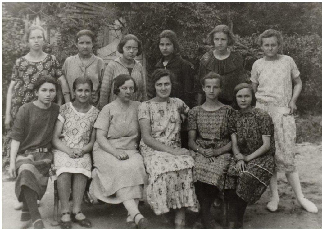
Ученице трећег разреда гимназије 1924/25. године