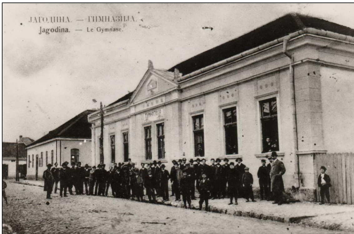
Зграда гимназије преко пута нове цркве

По оснивању, гимназија је радила у згради основне школе (ткз. „стара општина“). Пред крај 19. века гимназија је радила и у згради у главној улици, која је срушена 1931. године, и на том месту саграђена је 1932. године нова зграда гимназије. Једна од зграда гимназије налазила се преко пута нове цркве (ул. Максима Горког). У овој згради постојале су четири учионице, две канцеларије, једно предсобље и један ходник, који је патосан циглама. Проширење зграде извршено је 1904. године средствима општине.