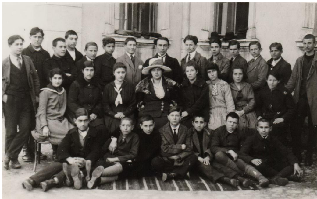
Ученици IV разреда гимназије 1919. Године

Промене од 10. јула 1919. до 28. јуна 1920. године: