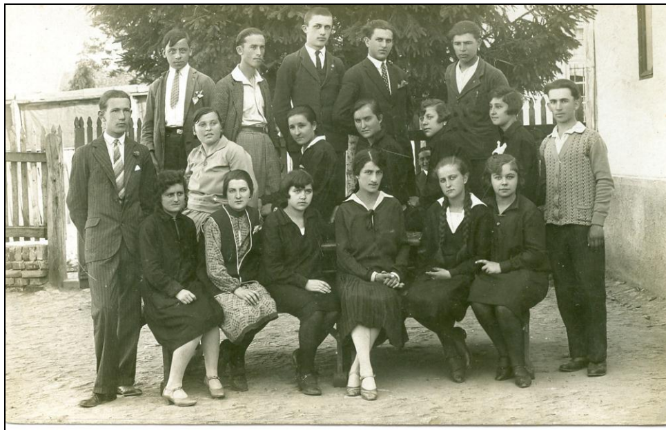
Шести разред гимназије 1923. године