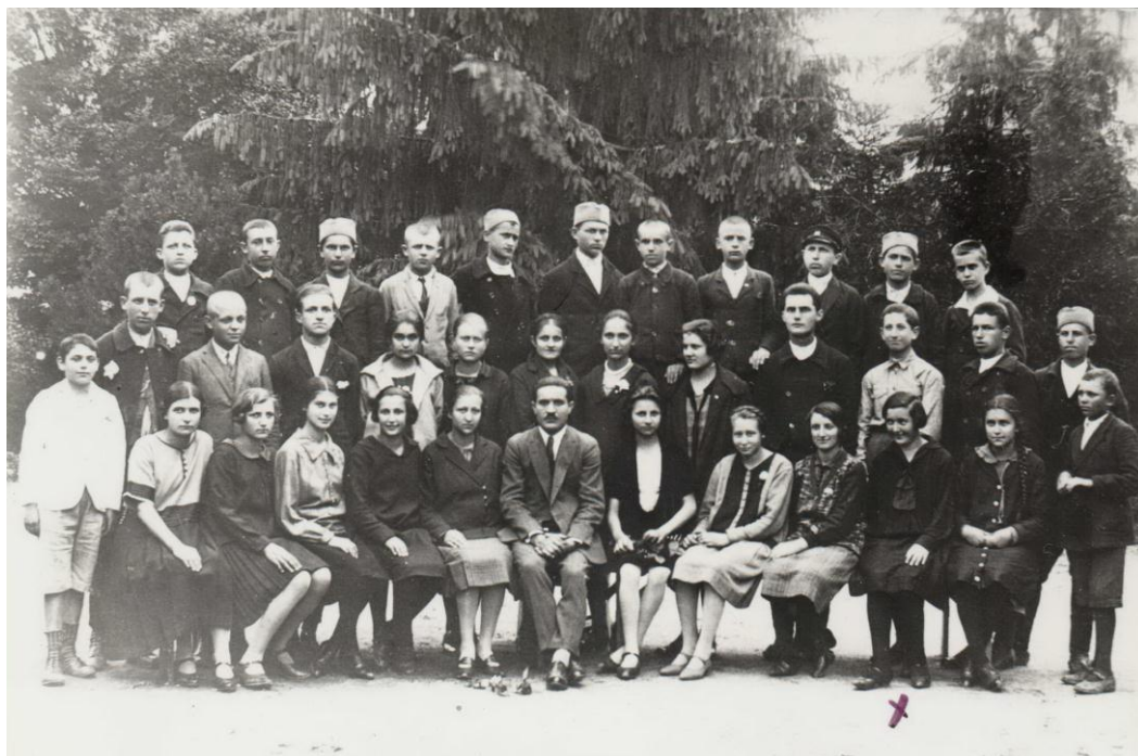
Ученице четвртог разреда гимназије 1926. године