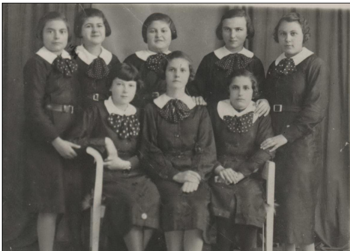
Ученице IV разреда гимназије снимљене 22. марта 1937. године