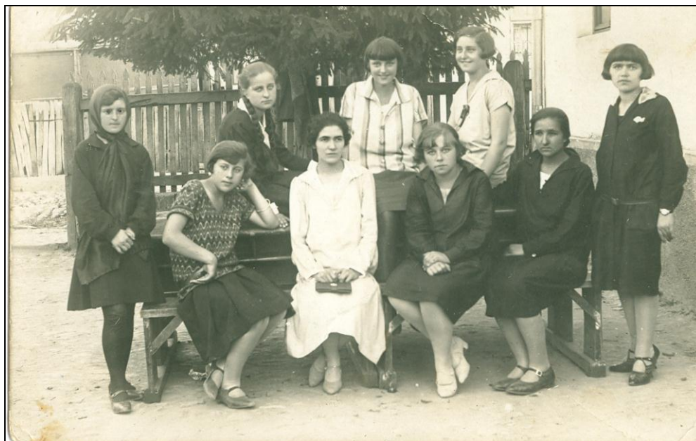
Ученице V разреда гимназије 1922. године