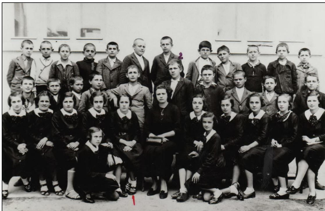
Ученици другог разреда гимназије снимљени 14. јуна 1936. године