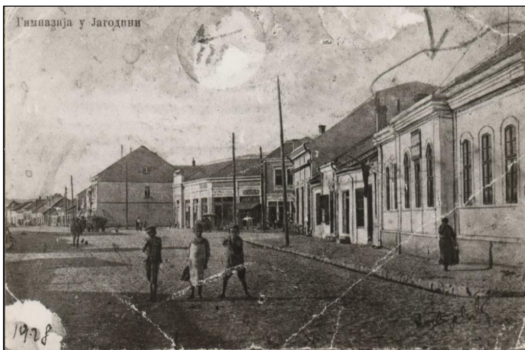
Зграда гимназије у главној улици

Рад у школи – Сразмерни део програма из појединих предмета није могао бити пређен у недостатку довољног броја наставника, те се из појединих предмета морала извести редукција часова. Цртање се није предавало, јер је наставник цртања премештен у Београд а други није дошао“. 8