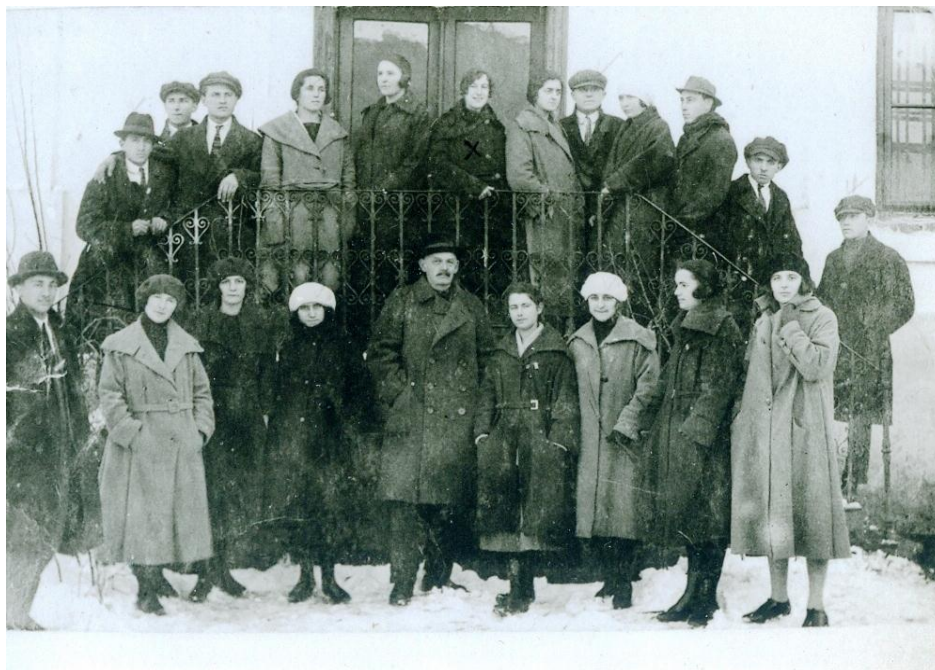
Мешовити хор гимназије

Стег није постојао током школске 1933-1934. године. Стање фонда на дан 28. јуна 1934. године износило је 266,50 динара и новац се налазио код Поштанске штедионице. Толико новца било је и наредне школске 1934-1935. године. 288