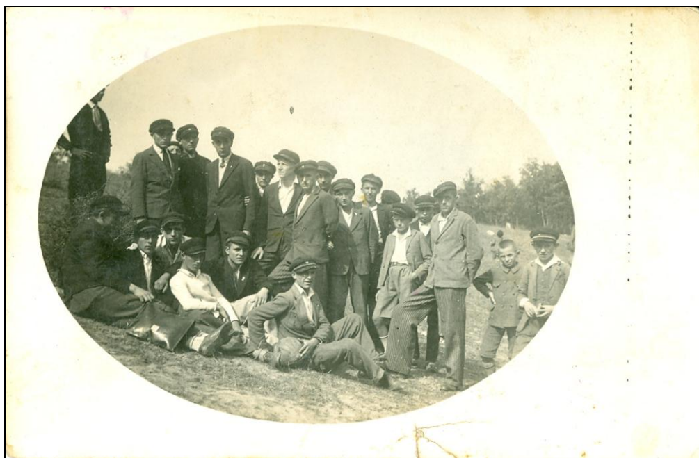
Ученици гимназије на излету

11. априла 1935. године са ученицима четвртог разреда полудневна научна до фабрике стакла у Параћину; 18. априла 1935. године са ученицима трећег и четвртог разреда поклонствена једнодневна до Опленца; 20. маја 1935. године са ученицима другог разреда полудневна ботаничка; 22. маја 1935. године са ученицима првог разреда полудневна ботаничка; 24. маја 1935. године са ученицима другог разреда једнодневна научно-забавна до манастира Св. Петке; 24 и 25. маја 1935. године са ученицима трећег разреда историјско-географско-васпитна до манастира Студенице и Жиче, а са ученицима четвртог разреда научно-васпитна до Сењског Рудника, Равне Реке и манастира Раванице; 25. маја 1935. године ученици првог разреда научно-забавна до манастира Јошанице; 1 и 4. јуна 1935. године са ученицима другог разреда полудневна ботаничка; 5. јуна 1935. године са ученицима првог разреда полудневна ботаничка; Осим ових екскурзија и излета, наставник физике је са ученицима трећег разреда 3. априла 1935. године посетио воденицу на Белици, а са ученицима четвртог разреда 23. маја 1935. године варошку електричну централу. 307