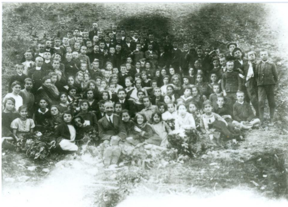
Ученици III-б разреда гиназије на излету у Бресју 22. маја 1922. године

Школске 1921-1922. године нису организоване опште екскурзије. Организоване су специјалне екскурзије за географију, хемију и физику. За географију организована је до манастира Јошанице, за физику и хемију до Пиваре, Кланице и до Лугомира, где је посматрано подизање моста. Ради забаве организовани су излети до манастира Јошанице, Паланке, Крагујевца, Алексинца и Ћуприје. 300