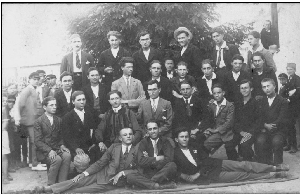
Ученици гимназије 1925-1930. године