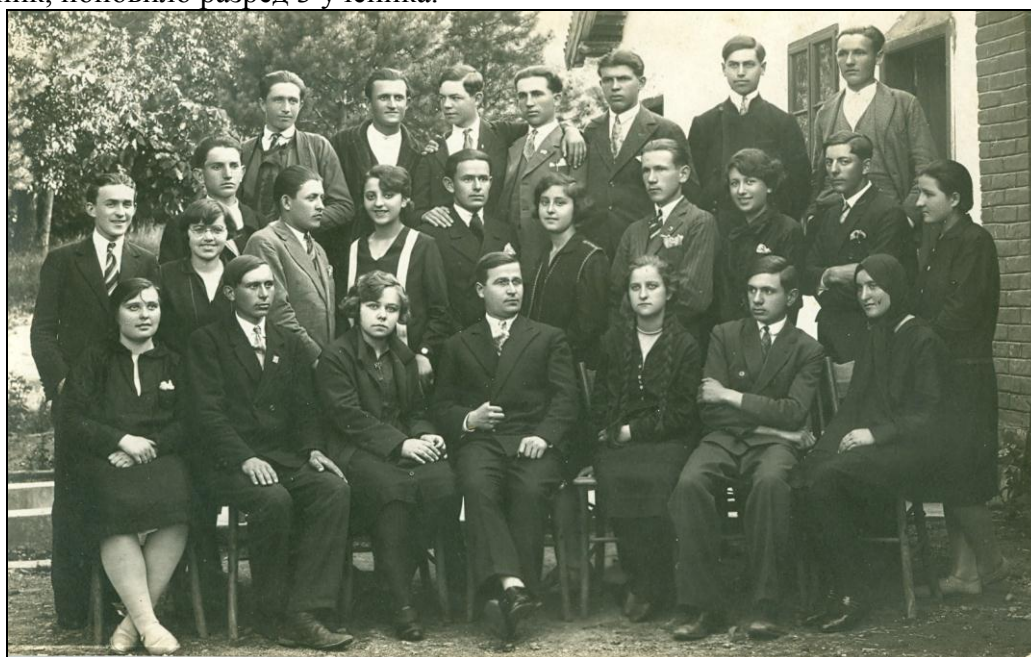
Седми разред гимназије 1924. године

VIII разред: уписано 20 ученика и 12 ученица, оставило школу 12 ученика и 3 ученице, свршило разред 10 ученика и 7 ученица: одлични 2 ученика, вр. добри 1 ученик и 4 ученица, добри 6 ученика и 3 ученице, положило разредни испит 1 ученик, поновило разред 3 ученика.