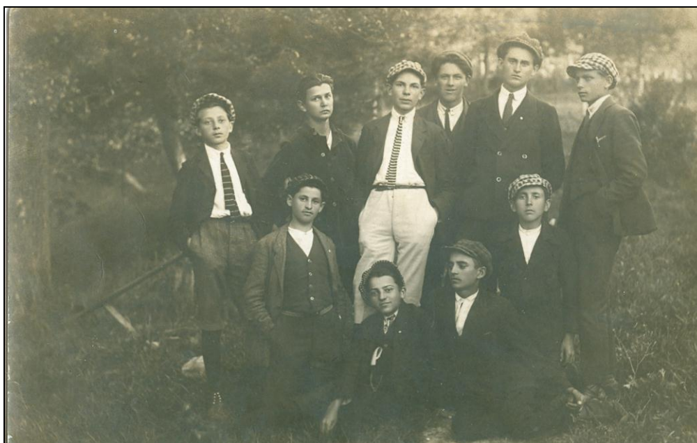
Четврти разред гимназије 1923. године

Према мишљењу изасланика из свих предмета успех је био довољан осим из математике и хемије, због нестручности наставника, и француског и латинског језика, због одсуствовања и болести.