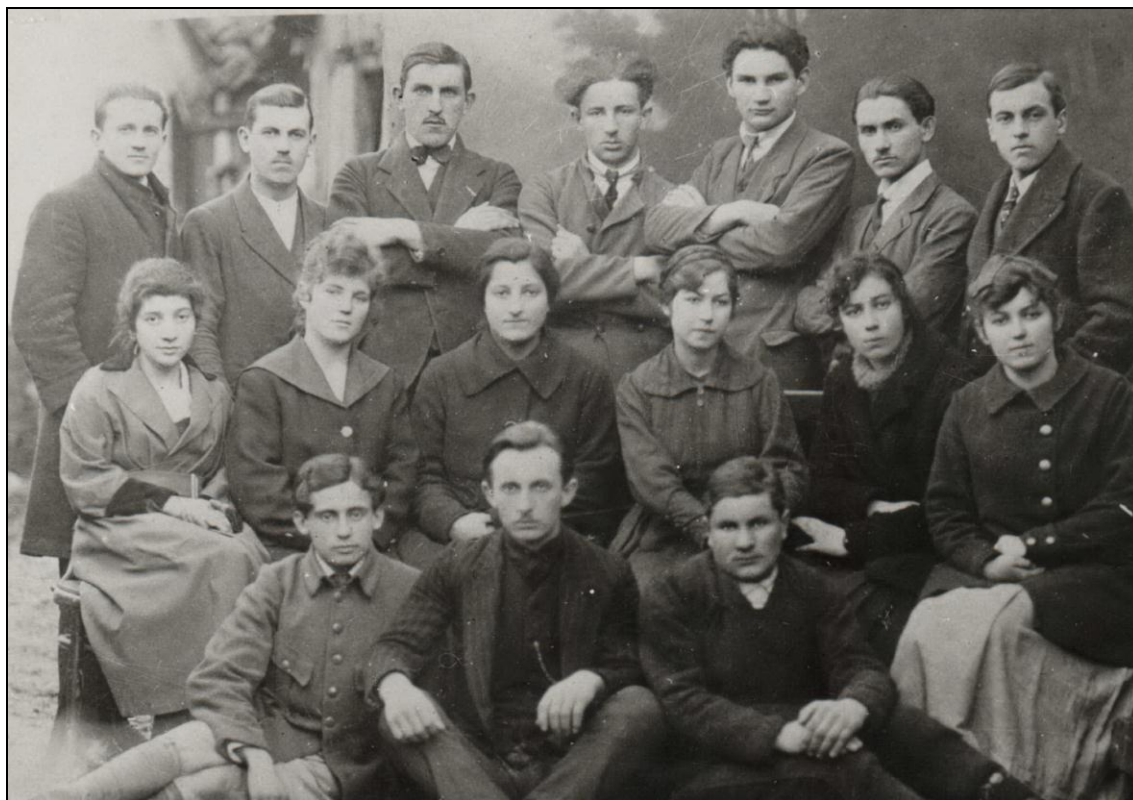
Генерација матураната гимназије школске 1920-1921. године