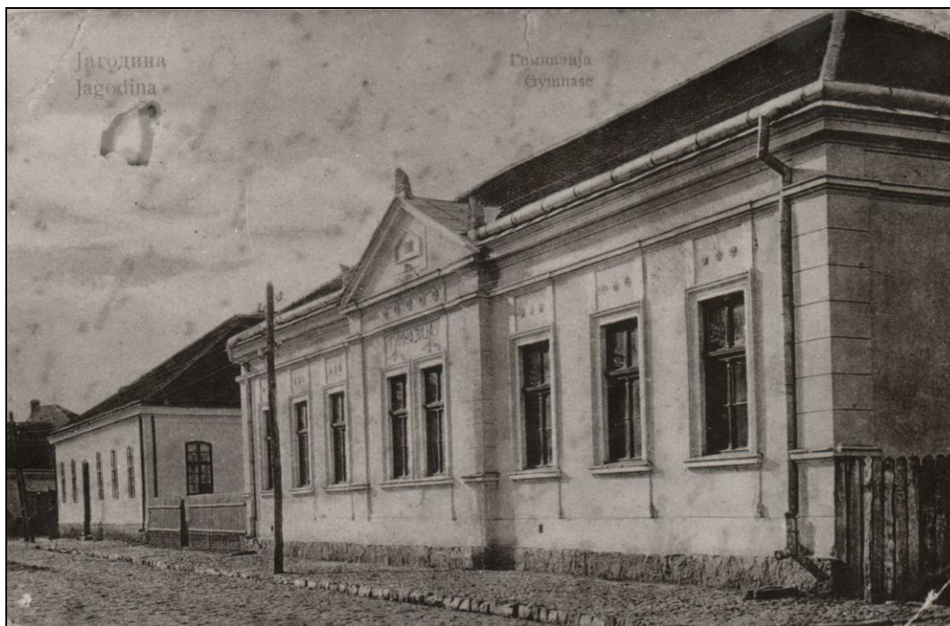
Зграда гимназице (ул. Максима Горког)