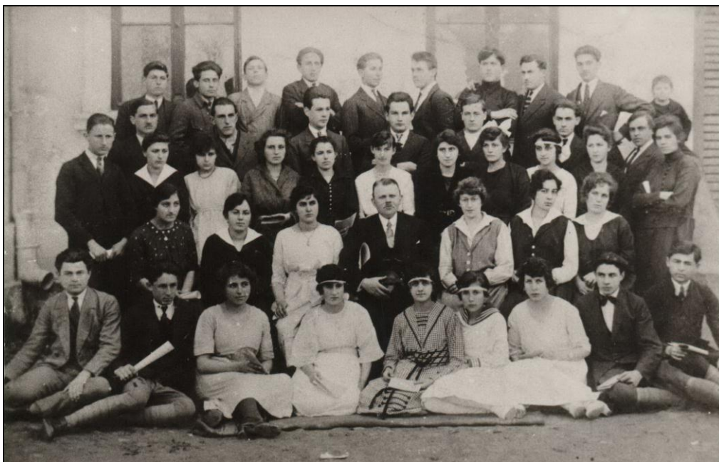
Светосавски хор гимназије 27. фебруара 1921. године

По одлуци министра просвете 7. октобра 1925. године привремено су затворени седми и осми разред. Разреди су затворени због малог броја уписаних ученика. У седми разред уписано је 9, а у осми разред 12 ученика. Ако би се поново отворили разреди потребно је примити једног наставника за француски језик и једног наставника за математику. Осим пријема нових наставника, у случају отварања разреда, гимназија би имала 15 одељења и не би био довољан број учионица. У школској згради било је девет учионица и три учионице у приватној кући, која није удаљена од школске зграде. У социјалном и културном погледу Јагодина је имала услове да буде седиште пуне гимназије. Јагодина је гравитирао левачки срез са 30.000 становника, белички са 41.000 становника и трећина деспотовачког среза са 6.000 становника. Збирке, учила и књижнице су непотпуне. 88