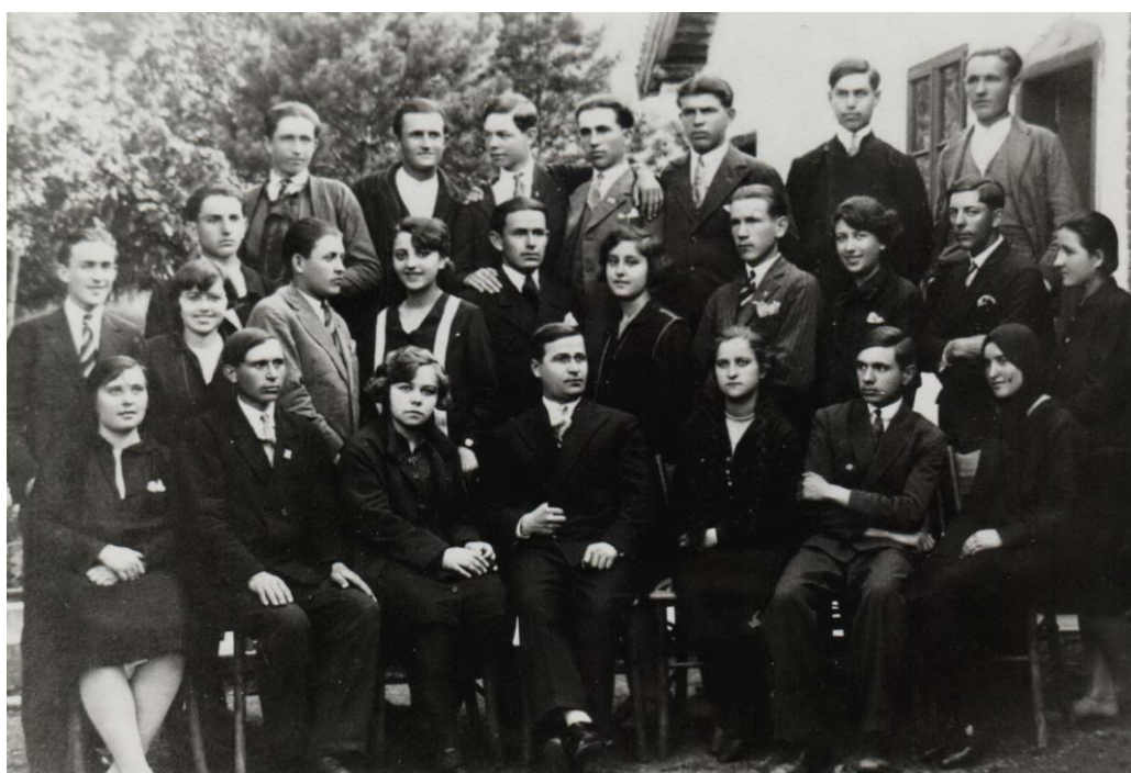
Ученици седмог разреда гимназије 1924. године