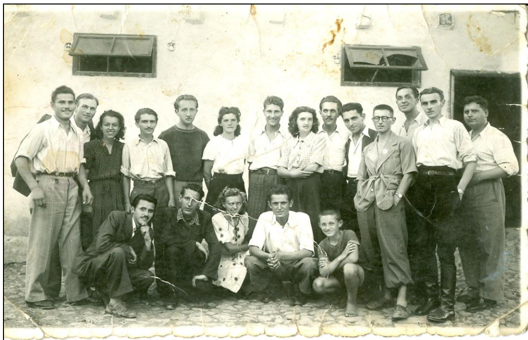
Матуранти гимназије половином 20-тих година