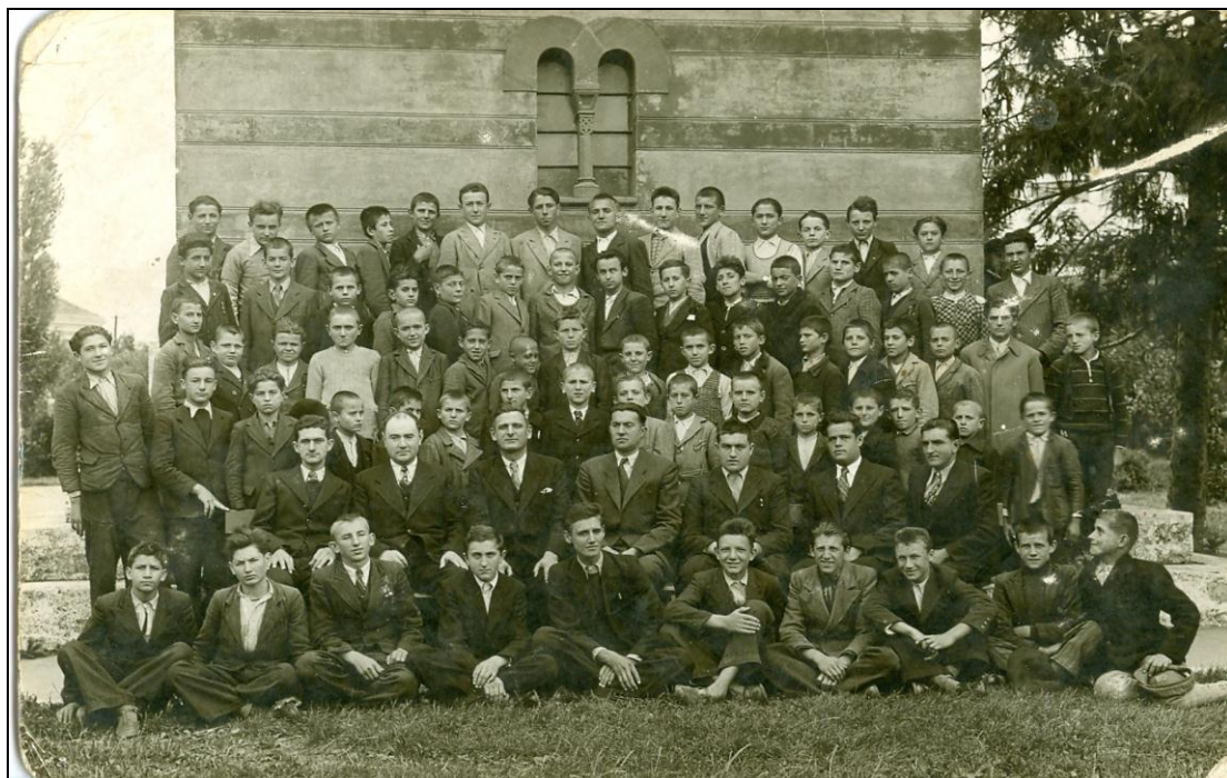
Ученици гимназије са професорима пред звоником нове цркве (око 1935-1938. године)