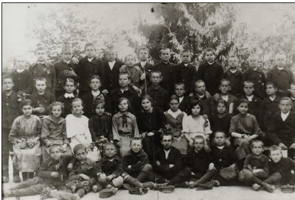
Ученици првог разреда гимназије током школске 1922-1923. године