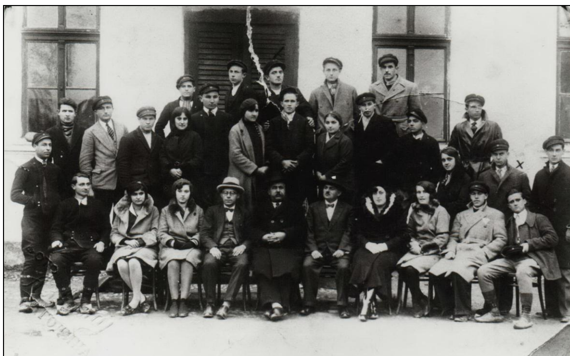
Ученици седмог разреда гимназије 1929. године