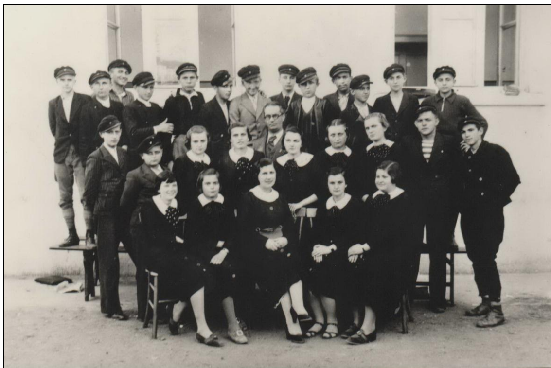
Ученици IV разреда гимназије 1939-1940. године

28. јуна на Видовдан саопштен успех ученицима.