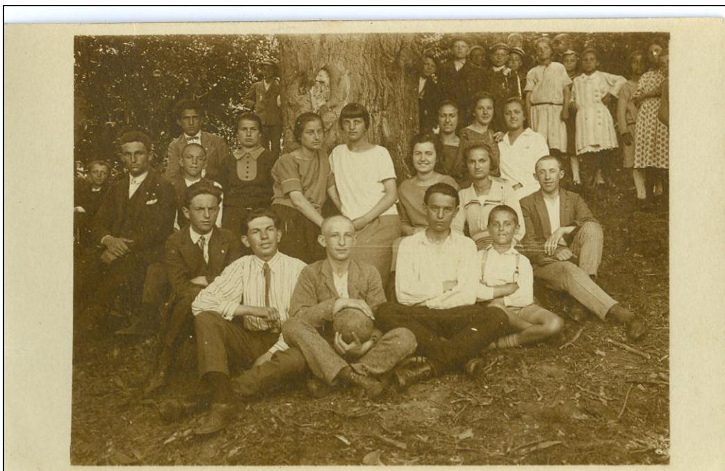
Са излета до мајурске воденице