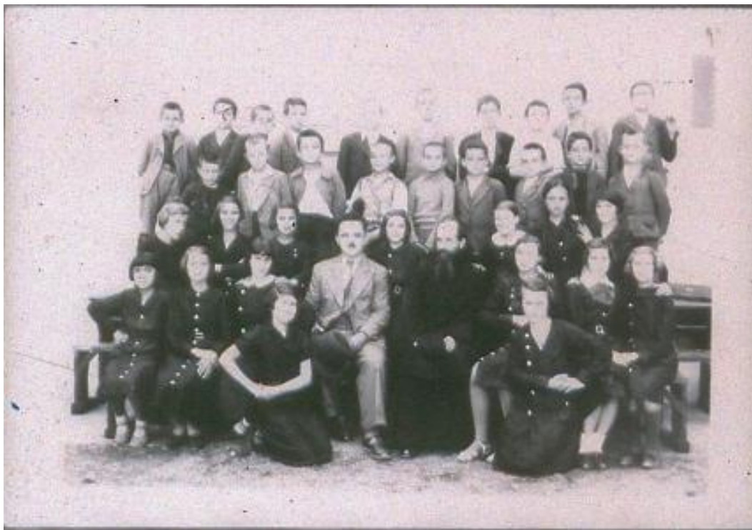
II-б разред гимназије јуна 1935 године