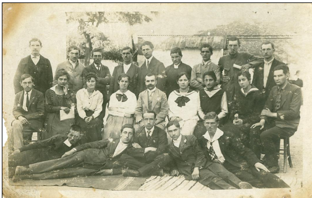
Баџи петог разреда гимназије 1919. године

С обзиром на бројно стање ђака, броја наставника, као и броја учионица у два зградама, прва три разреда подељена су на по два одељења, а четврти, пети и шести разред остали су са по једним одељењем. Мада је четврти разред имао велики број ђака, није одмах подељен, јер је радио у пространој учионици, већ је то учињено крајем истог месеца. То је исто важило и за пети разред. 24