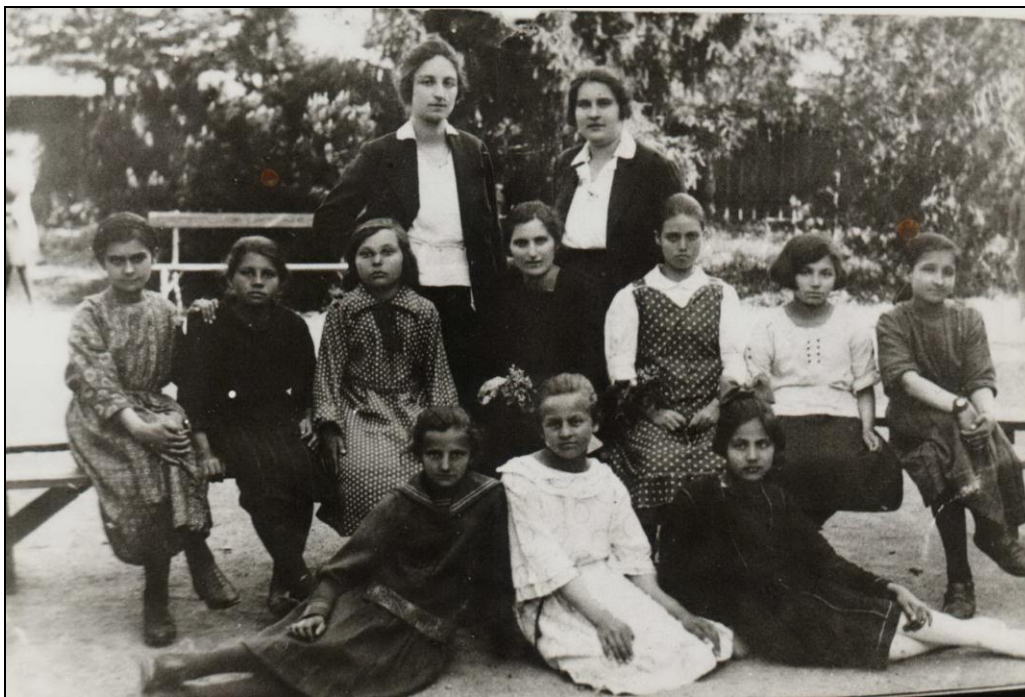
Група ученица првог разреда гимназије са својим наставницама школске 1923/24. године