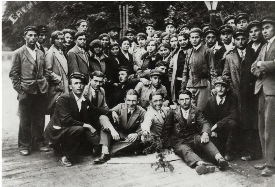
Ученици гимназије у Врњачкој Бањи 1930. године

јуна 1928. године. И следеће школске године организован је 8. јуна 1929. године само један излет у околини. 303