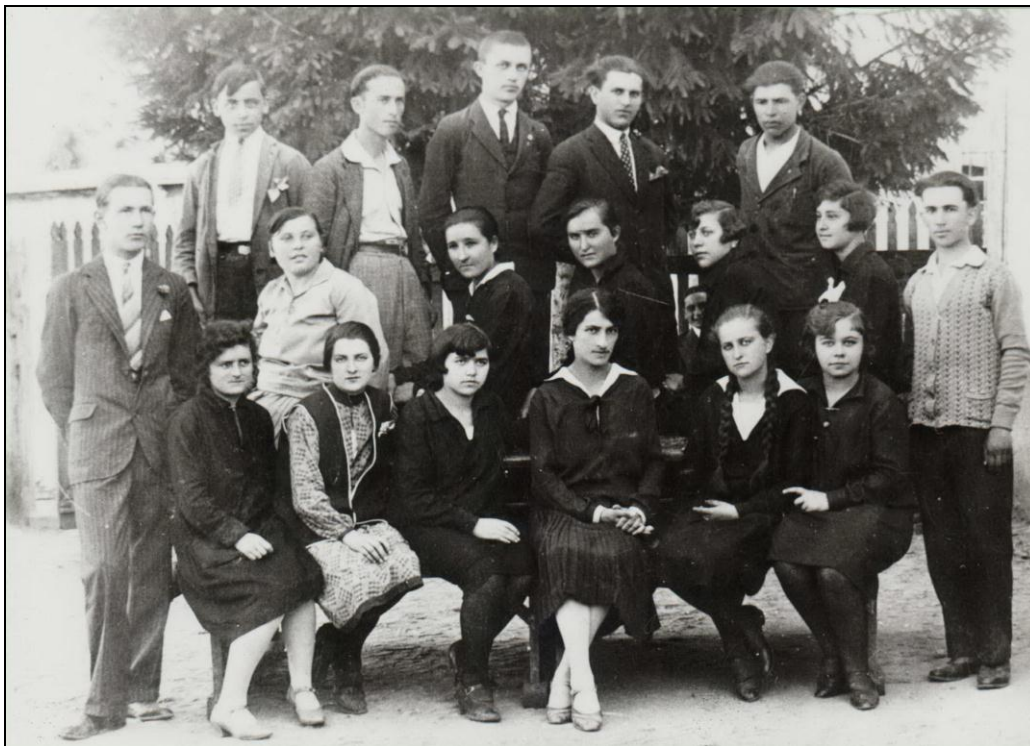
Ученици шестог разреда гимназије 1923. године