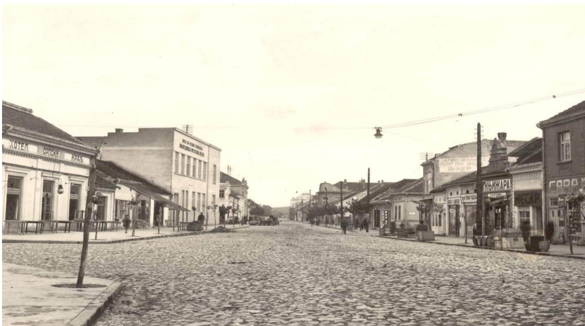
Центар Јагодине са зградом гимназије 1935-1938 године