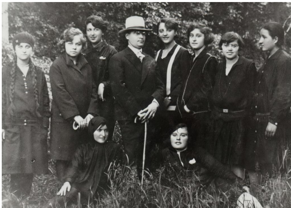
Ученице седмог разреда гимназије 1923. године