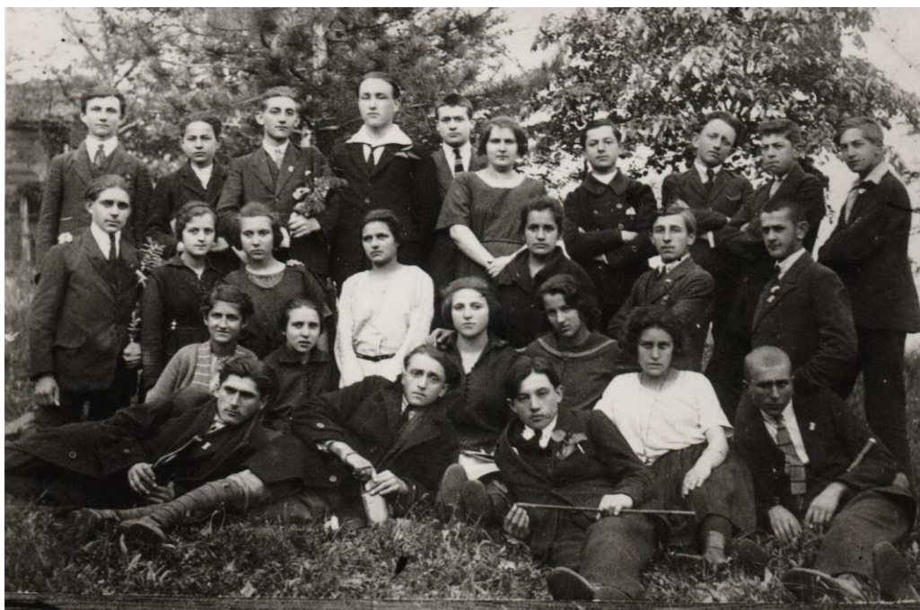
Ученици гимназије школске 1924-1925. године