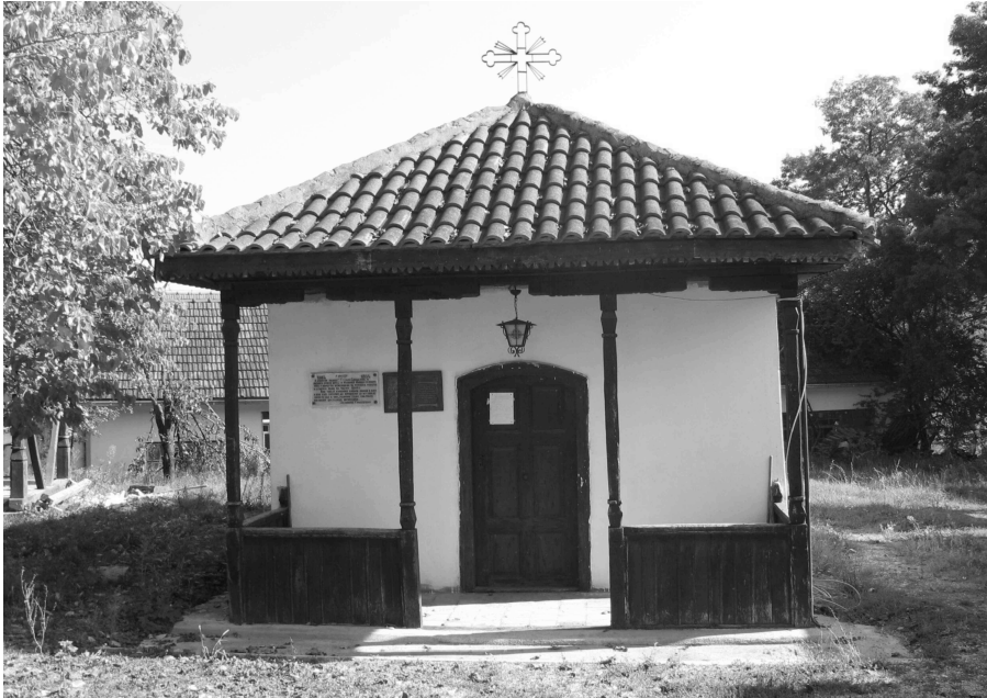
Капела Стевана Синђелића у Грабовцу

Карађорђе се за помоћ обратио Русима. Тражио је, на основу обећања, да Руси пређу Дунав и да тако привуку турску војску. Устаничке снаге нису биле довољне да успешно ратују на више фронтова, јер су због неактивност руске војске, Турци велике снаге упутили према устаницима, а нарочито према Нишу.