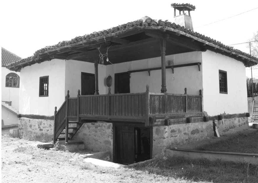
Кућа Стевана Синђелића у Грабовцу